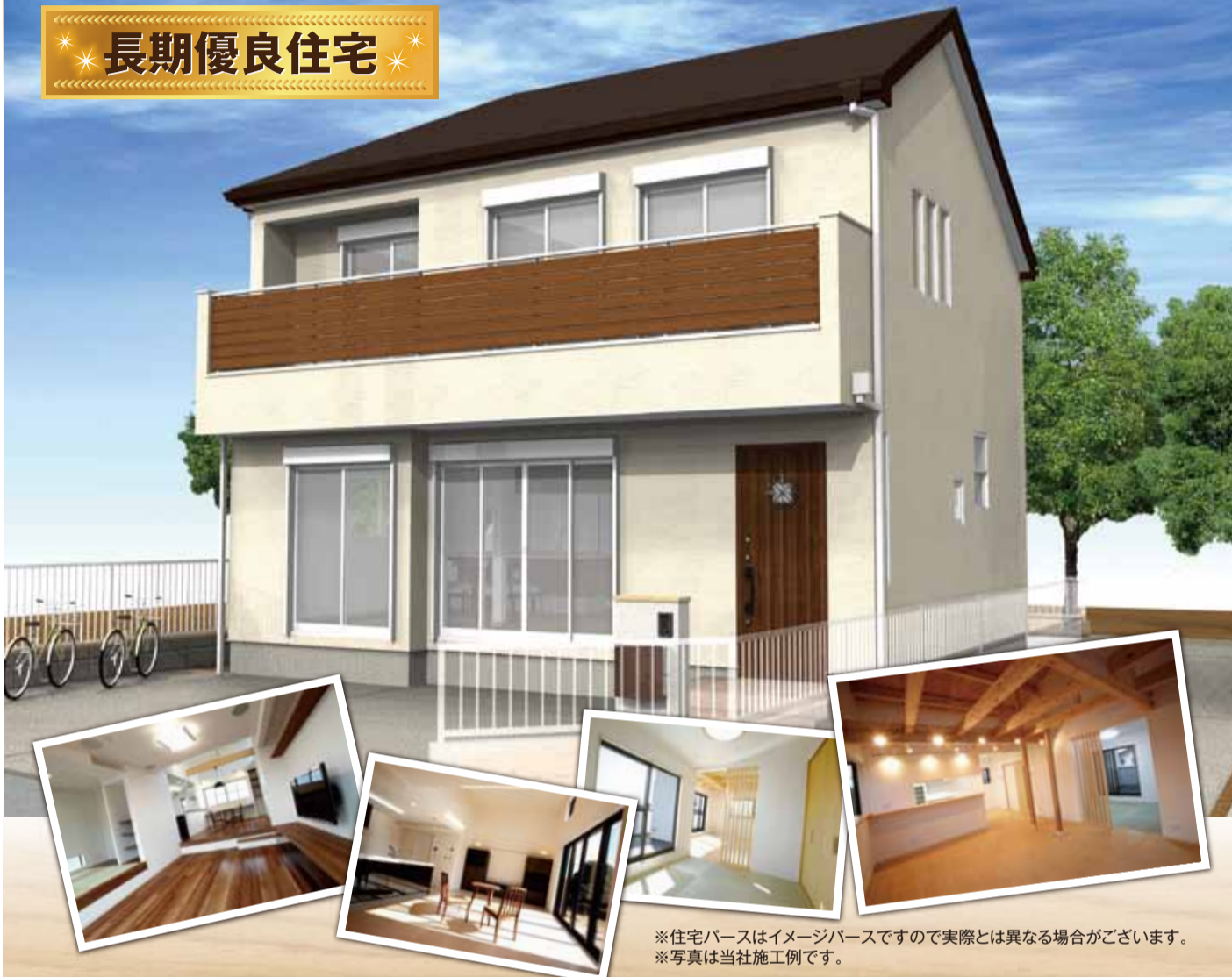
※住宅パースはイメージパースですので実際とは異なる場合がございます。 ※写真は当社施工例です。